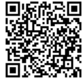
二次元バーコード