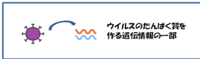
mRNA(メッセンジャーRNA)・ウイルスペクターワクチン

mRNA は身体の中に入ると、ウイルスタンパクを作ります。ウイルスタンパクは「ウイルスが侵入したぞ!」ということを身体に教えます。その指令を受けて身体は抗体(ウイルスをやっつける物質)を作ります。