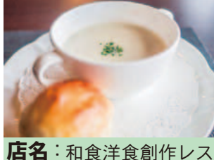
店名: 和食洋食創作レストラン南風原 メニュー: ハーフビュッフェランチ たっぷりキャベツの冷製ポタージュスープ