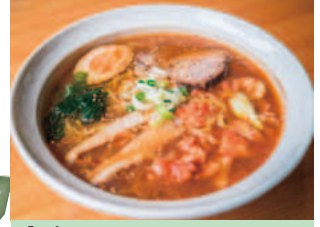
店名: 南幌ラーメン きらら メニュー: キャベツキムちらーめん