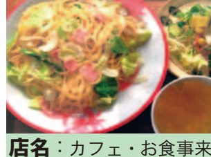
店名: カフェ・お食事来未 メニュー: たっぷりキャベツのクリームパスタ