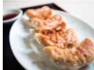
店名: プラザホテル 二合半 メニュー: 南幌産キャベツたっぷりギョーザ