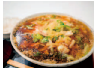
店名: ラーメン・居酒屋 夢玄 メニュー: 麻辣キャベツラーメン