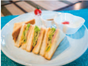
店名: 喫茶 ブアンサニット メニュー: キャベツソーテーとパストラミのサンドイッチ

スタンプラリーと同時開催する『なんと!キャベツ ぼく 博』では、町内飲食店12カ所で、南幌産キャベツを使用した期間限定メニューを提供します。下記に各飲食店の7～10月の期間限定メニューを掲載しますので、是非ご賞味ください。