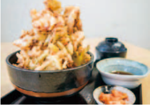
店名: なんぽろ温泉 ハート&ハート メニュー: ド〜んとキャベツ天井