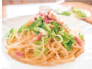
店名: メイプルリーフ メニュー: とうでい'Sキャベツち Pasta (日替り)