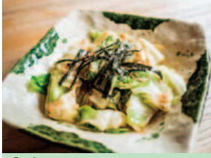
店名: すしはんガーデン メニュー: 地物野菜の変わりサラダ