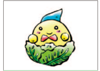
店名: カントリーパブ サウストップ メニュー: オーイ!!キャベツ君 今日は何に成るの?