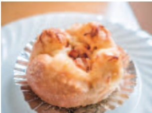
店名: Vegepanna ベジパンナ メニュー: 南幌キムチマヨチーズ