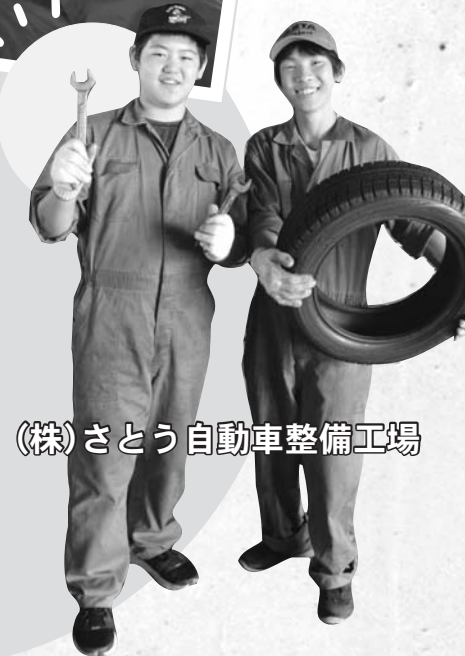
(株)さとう自動車整備工場