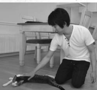
仕事の合間は愛猫とまったり。自分のペースで働けることも、この仕事の魅力なんだとか。

奈良県出身。大学時代、就職活動をするさなか、自身が開発したアプリケーションの提供を開始。昨年、南幌町の子育て世代住宅建築費助成制度を知り移住。