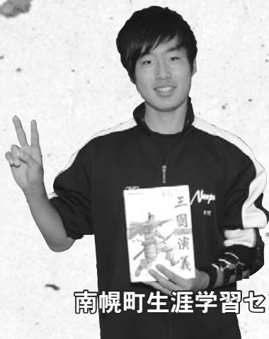
南幌町生涯学習センター 図書室