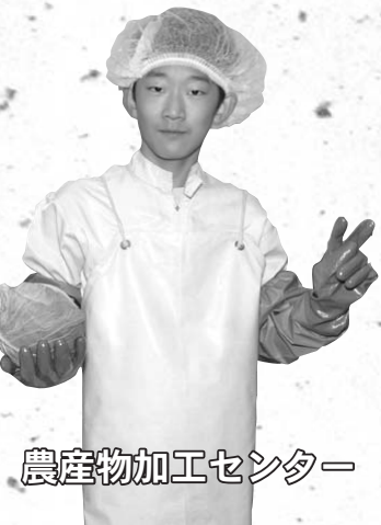
農産物加工センター